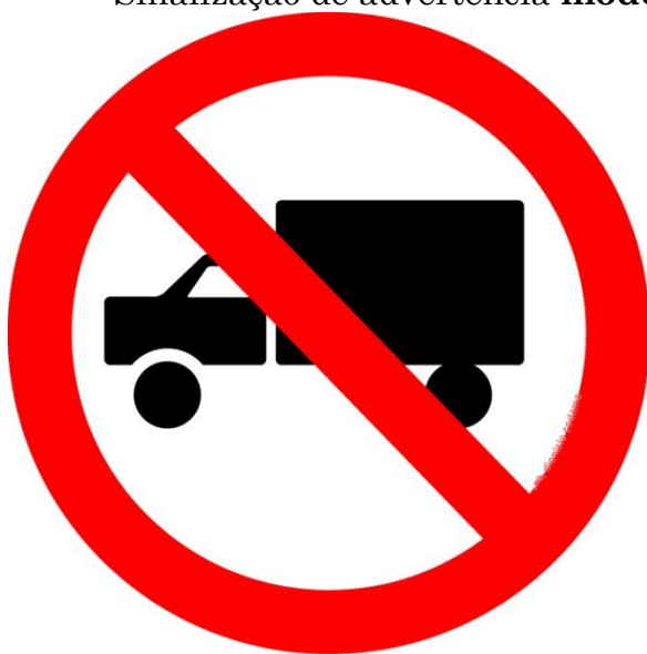
R-9 — Proibido trânsito de caminhões