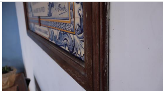
Figura 10: Detalhe da moldura em madeira.