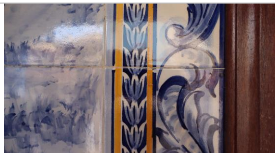
Figura 09: Detalhe da pintura floral e de acantos