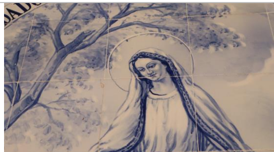
Figura 07: Detalhe da pintura da Virgem Maria