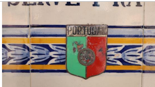
Figura 04: Detalhe do brasão português