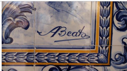
Figura 06: Detalhe da assinatura do artista