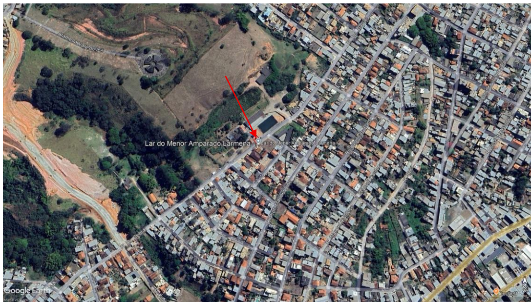
Figura 11: Mapa de localização do LARMENA onde se localiza o Painel Português