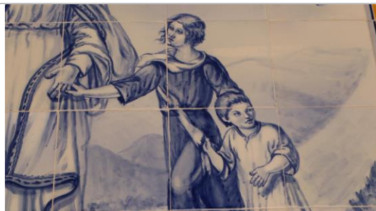
Figura 08: Detalhe da pintura das crianças