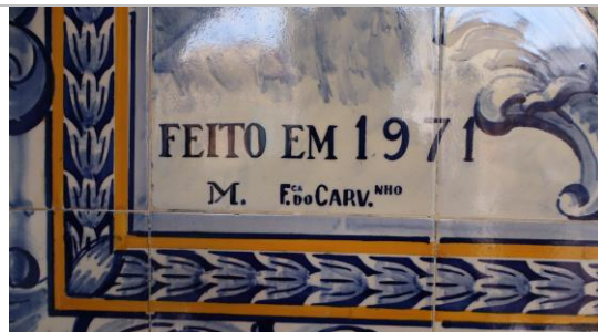
Figura 05: Detalhe da datação e fábrica