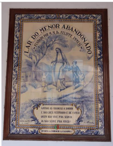
Figura 01: Vista do Pannel de Azulejo Português do Larmena Autoria: Tayami Fonseca França