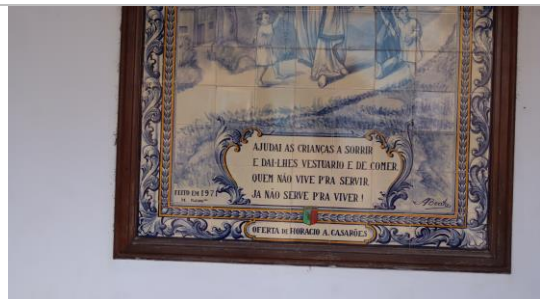
Figura 03: Detalhe da frase na parte inferior do painel